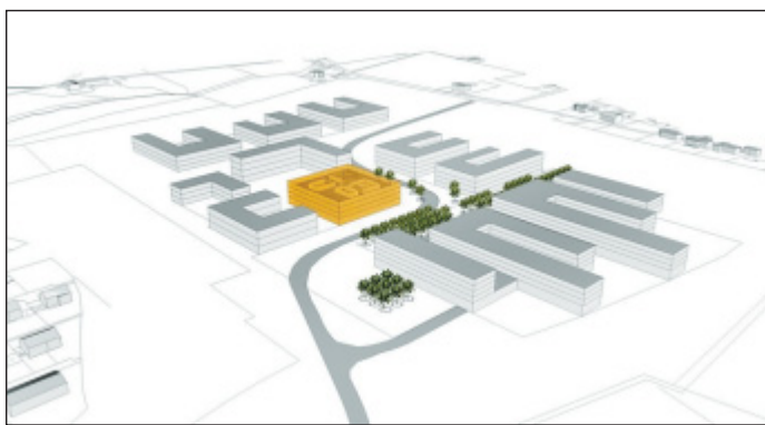
Im Mittelpunkt des Campus' Nord: Der Uni-Forschungsbau, hier farblich hervorgehoben; vorne die Fachhochschule.

■ Bielefeld. Großes passiert derzeit in Bielefeld. Da sind Politik und Hochschulen einig. Gestern dokumentierten Universitäts-Leitung, Oberbürgermeister und Wissenschaftsministerium diese Auffassung, als sie symbolisch für den Baubeginn des neuen Forschungsgebäudes der Universität auf dem Campus Nord das Bauschild enthüllten. Darauf zu sehen ist die zukünftige Heimat von über 250 Wissenschaftlern.